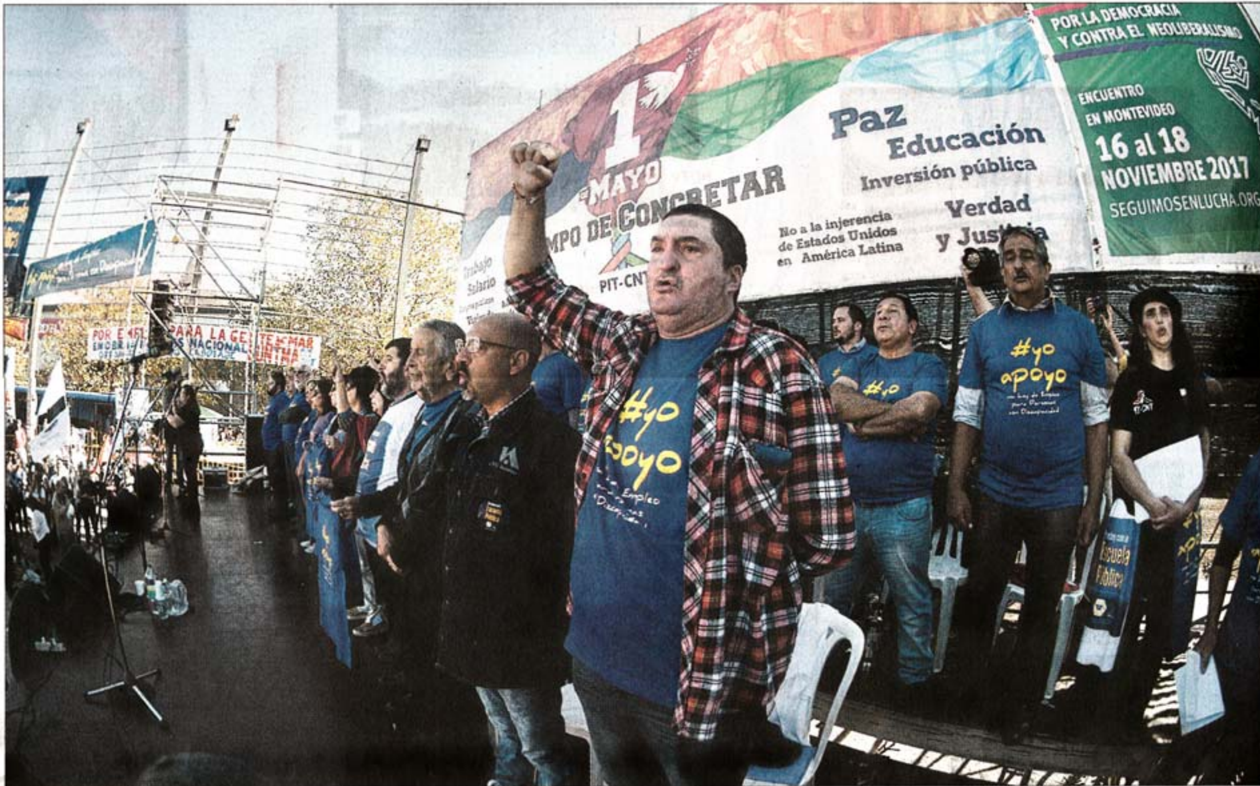
OFENSIVA. El 1° de mayo el Pit-Cnt ya planteó que creía que la recaudación por el Impuesto al Patrimonio es demasiado baja y que son demasiadas las exoneraciones.

En el impuesto al patrimonio los principales activos