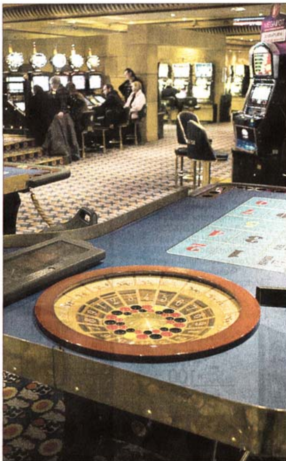
PLANTEOS. La central impulsa gravar las herencias y el juego.