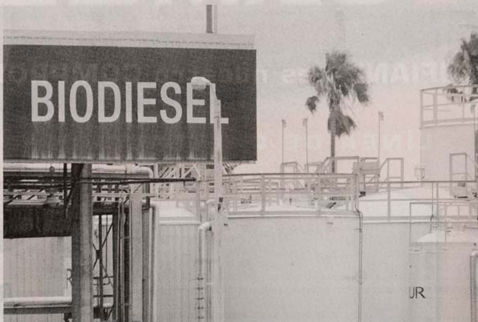
ALUR decidió que regularizará el pago que hizo durante una década a los cañeros

Los beneficiarios de ese dinero son 1.585 cortadores de caña de azúcar, más otros 1.000 trabajadores entre los que se cuentan maquinistas, tractoristas, rejuntadores de caña y graperos, que son los que cargan los camiones. Esta semana, ALUR reconoció en un comunicado el pago “a 1.500 cortadores de caña”—no menciona a los demás trabaja-