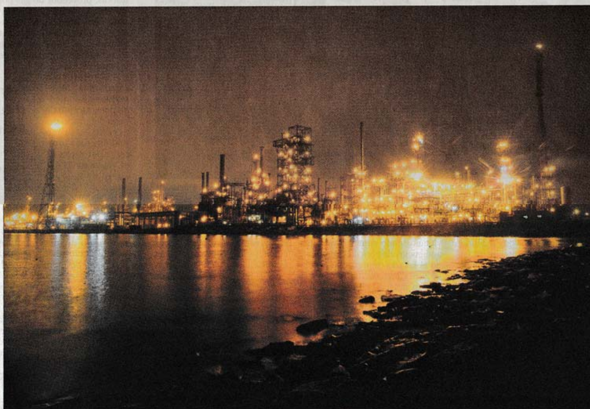
IMPACTO. Desde mediados de febrero la refinería de La Teja de Ancap está detenida por una parada técnica, lo que se refleja en los datos.

En la vereda de enfrente, la división que tuvo la incidencia positiva más destacable duran-