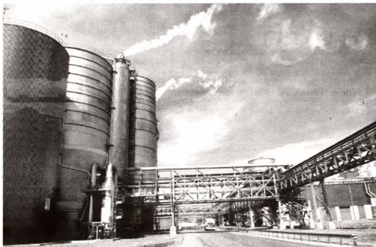
Montes del Plata

Se sabe, o al menos se debería suponer, que estos emprendimientos monstruosos no vienen, piden permiso y se instalan alegremente aceptando las reglas de juego que el país decida ponerles. Más bien son ellos los que ponen condiciones porque, en la escala de nuestra economía, estas inversiones suelen mover positivamente la aguja del PBI y dinamizan por un tiempo las finanzas locales. Con ese poder