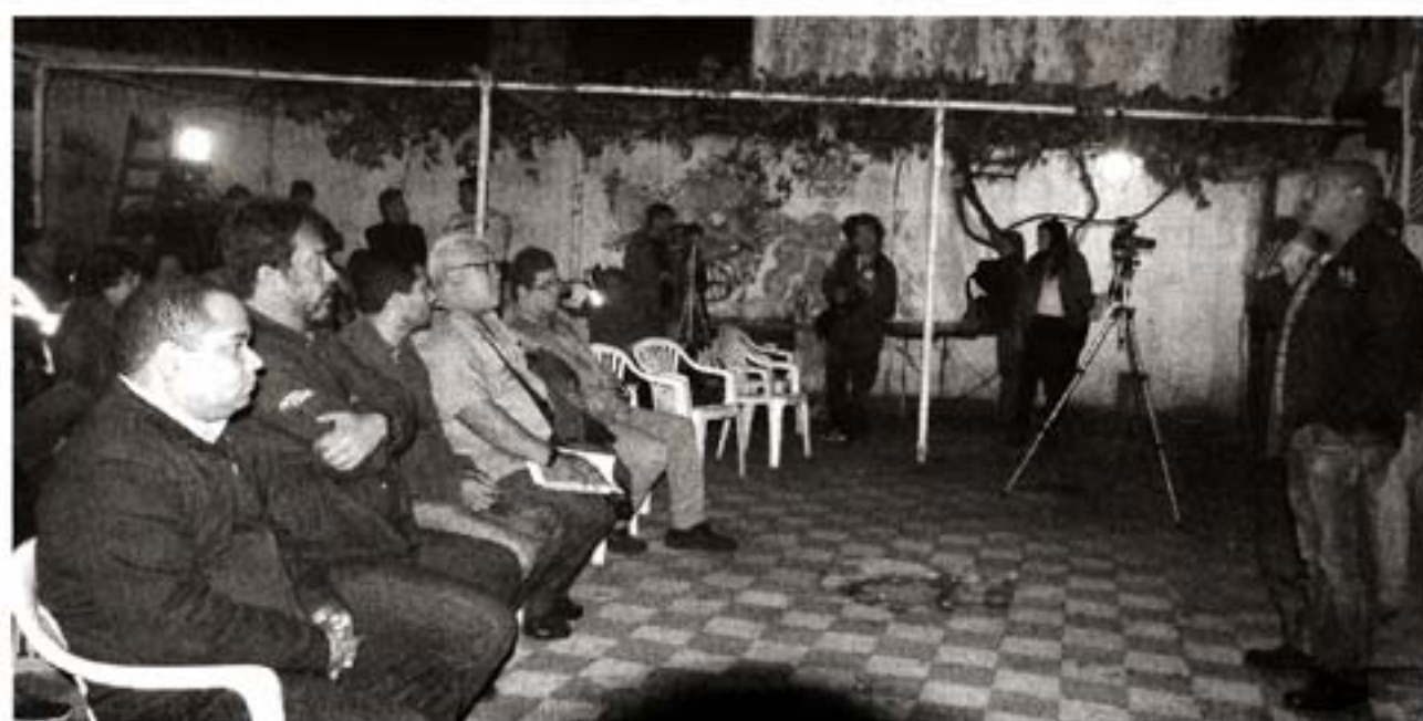
En el club Artigas, en La Teja

siempre lo ha hecho, por la unidad de los trabajadores, también a nivel continental, para defender la democracia, los avances populares y enfrentar la ofensiva del imperialismo. Que se expresa en Venezuela, pero también en Brasil, donde Temer y el Congreso acaban de derogar la Ley de 8 horas, de un plumazo, y hay resistencia de los trabajadores y represión del gobierno, y nadie dice nada».