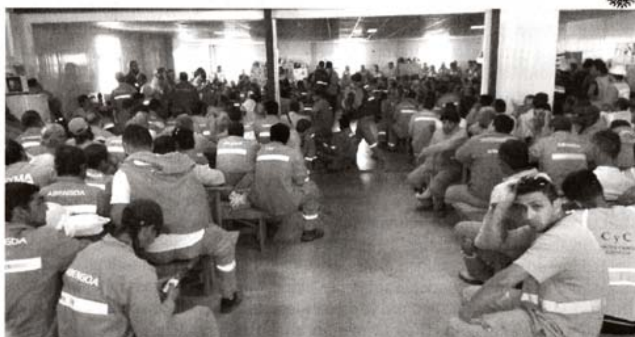
Intercambio directo con los trabajadores