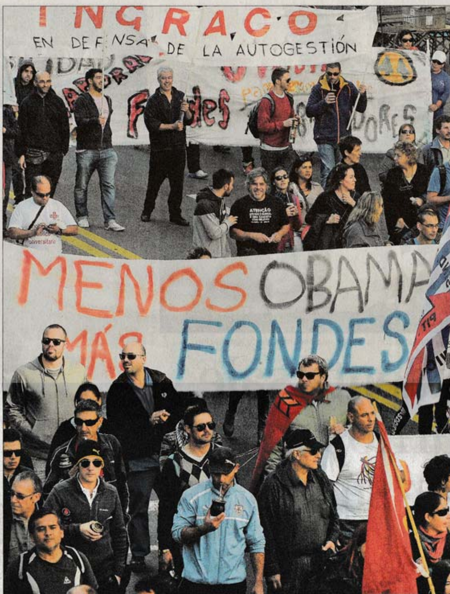
PLANTEOS. Dos corrientes creen que "en los hechos predomina el proyecto del capital transnacional".

"Seguimos siendo un país con una economía subdesarrollada, con altísima oferta de servicios, extractivista, empeñada en la práctica del monocultivo y el uso de los transgénicos, exportador de materia prima sin valor agregado, dependiente y endeudado", lamentan las corrientes críticas. "De la bonanza económica del gobierno anterior solo nos quedó la ilusión, algunas mejoras sobre todo en la agenda social y la cultura del endeudamiento plástico", resumen la "41" y la "5 de marzo".