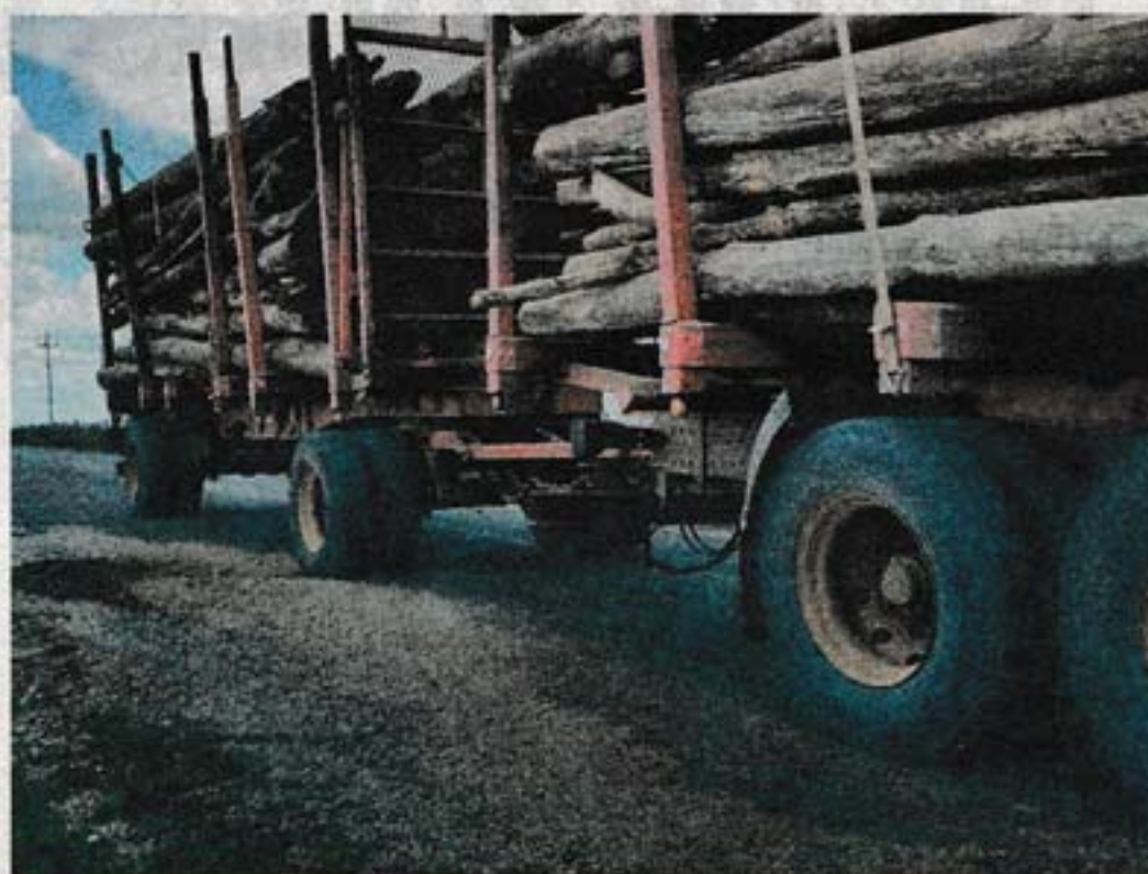
Patronal endureció medidas de lucha tras conflicto en arroz. G. CHARQUERO

A última hora de ayer, la ITPC dispuso el ingreso de camiones que aguardaban en los accesos al puerto de Montevideo y comunicó