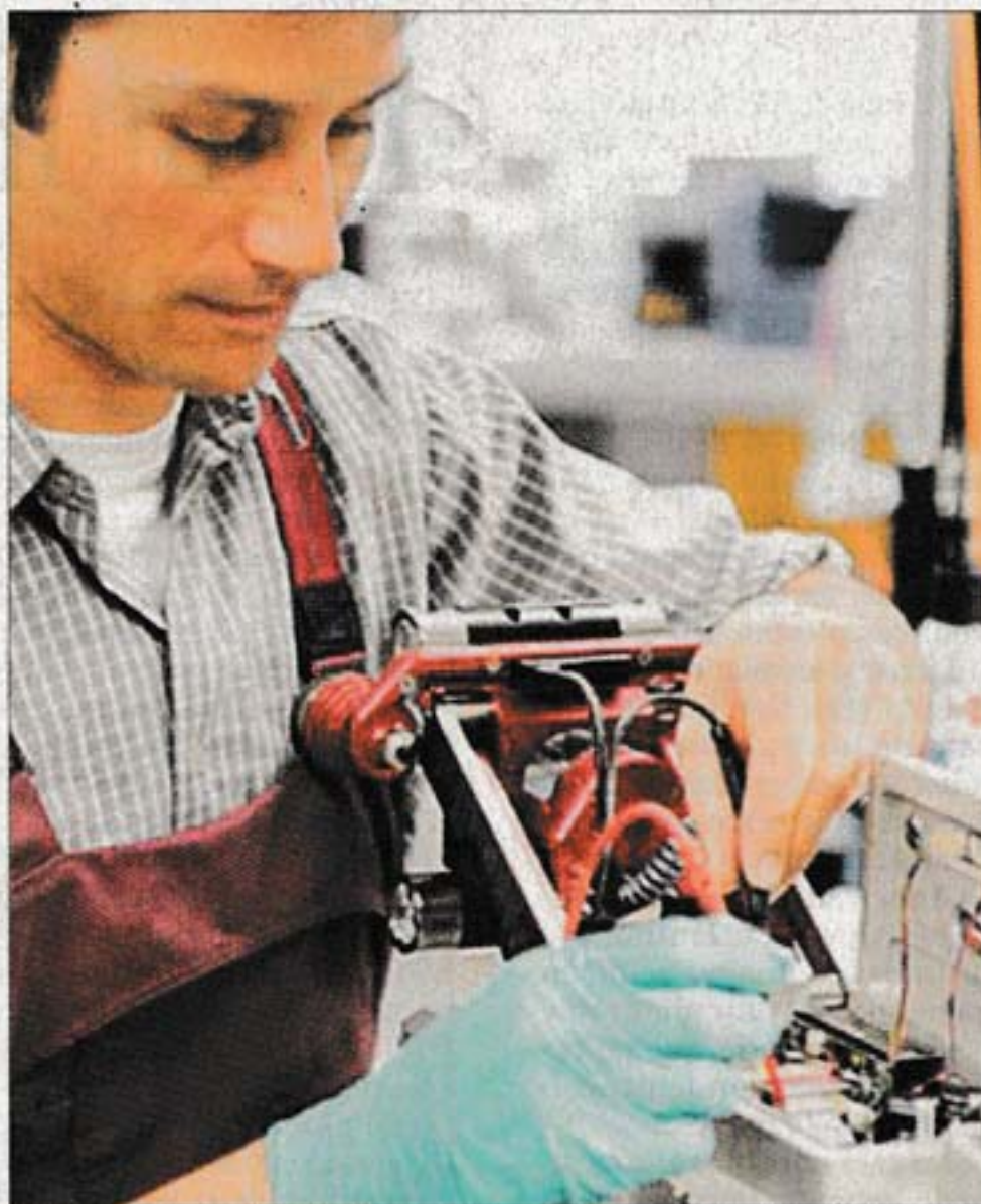
CAÍDA. Solicitudes de técnicos fueron las que más descendieron.

La demanda tanto de gerentes como de directores fue la que se vio menos golpeada el