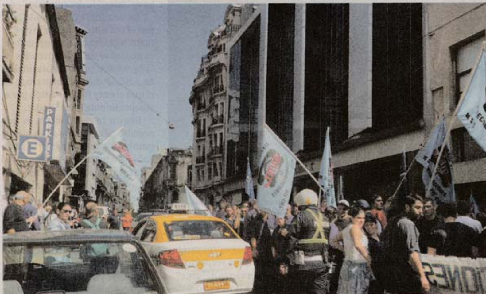
El decreto para piquetes fue firmado el 20 de marzo

Si bien la presentación del recurso fue liderada por COFE, el documento lleva la firma de otros sindicatos, como la Federación de