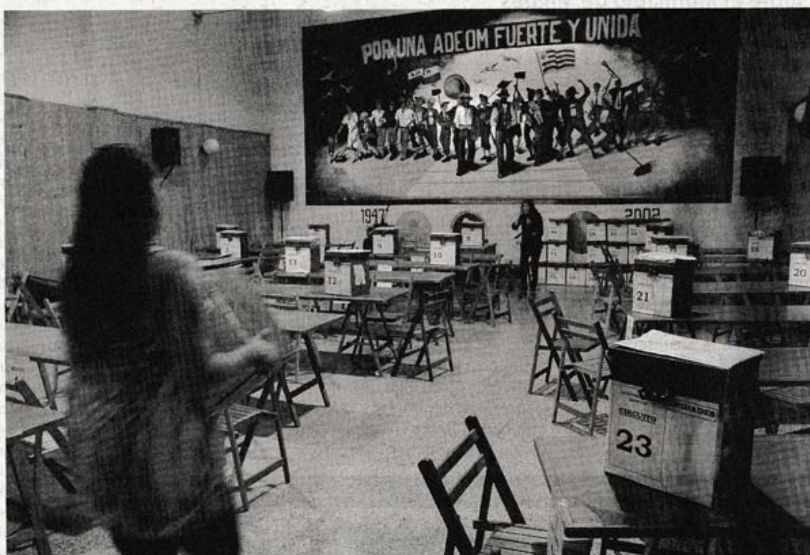
Sede de la Asociación de Obreros y Empleados Municipales.

Cladera, que en la lista 307 es el primer suplente de Varela, dijo que su agrupación buscará "mejorar el salario sobre la base del convenio que ya existe, reforzar los aspectos de seguridad laboral y mejorar la organización". "Estamos perdiendo muchos derechos y beneficios