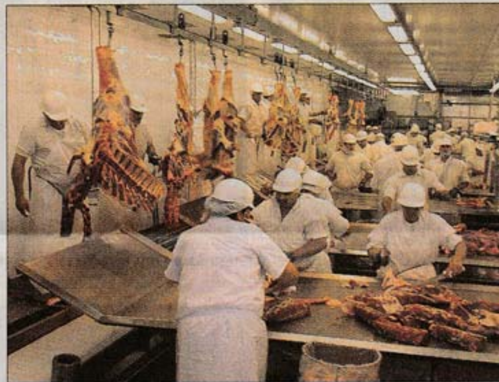
RELEVAMIENTO. Pese al paro, en 55% de plantas hubo actividad.

Según información a la que accedió El País, en la instancia en el MTSS se decidió que las negociaciones pasaran a "un cuarto intermedio" hasta que los representantes de los traba-