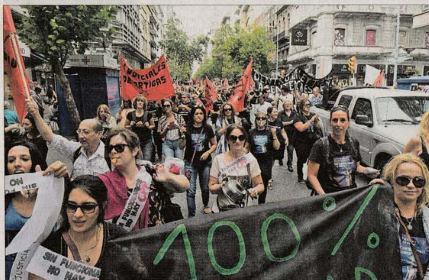
NO TERMINA. El gran lío generado por el "enganche" de los sueldos judiciales parece lejos de su fin.

El sindicato también decidió "en los asuntos de contenido