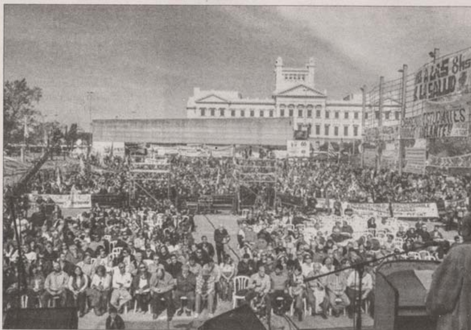
MILES A LA PLAZA, TEMPRANITO. Habrá tres oradores centrales, además de espectáculos y mucho compromiso.

El 6% del PBI debe ser destinado para la educación lo antes posible, será de los temas centrales.