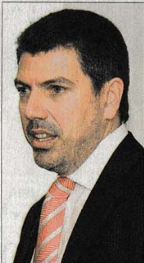
"Egresados en 2014 de ingeniería, química y ciencias no llegan a igualar a psicólogos".

INCENTIVOS. Todos estos análisis llevan a centrar el foco del