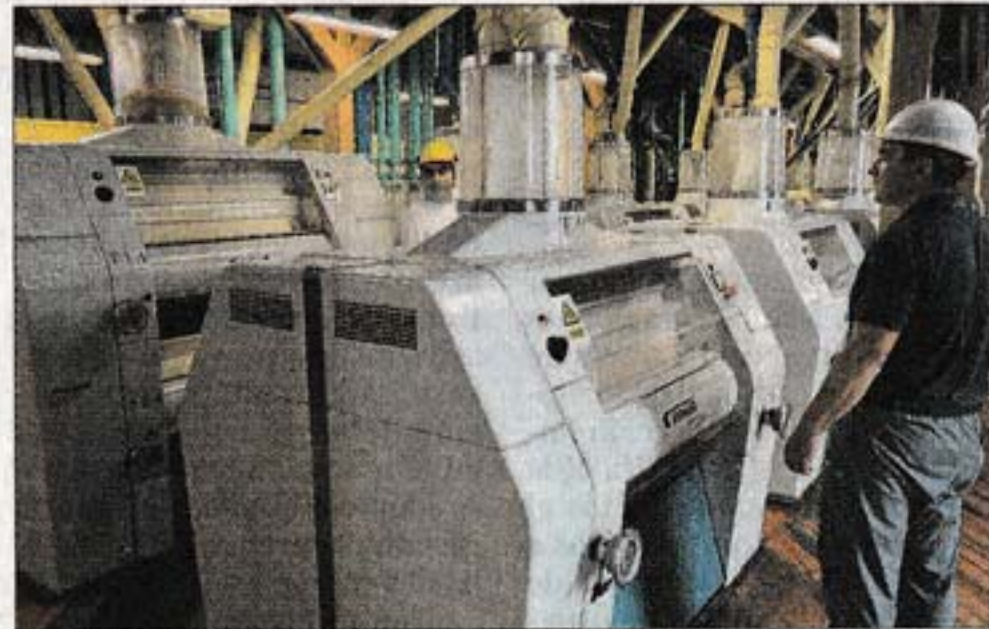
MOLINO. Reabrió y buscan venderlo rápidamente.