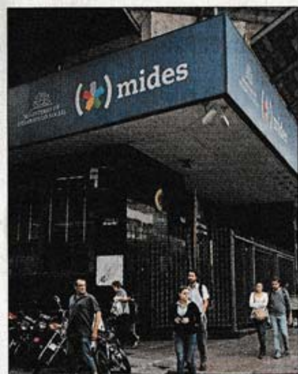
El Mides investiga a los migrantes.