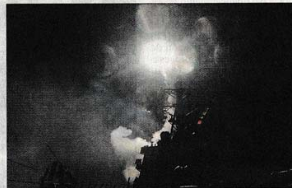
CRÍTICA. El PIT rechazó los ataques de EE.UU. y el régimen sirio.

Uruguay recibió en 2014 a cinco familias de refugiados sirios que suman 45 personas. Algunos de los refugiados sirios están acampando en la Plaza Independencia y reclaman salir del país. La secretaria de Derechos Humanos de la Presidencia de la República gestionó ayer que se les permita instalarse bajo la cercana columnata del Palacio Estévez (la vieja Casa de Gobierno) para que los niños no estén a la intemperie.