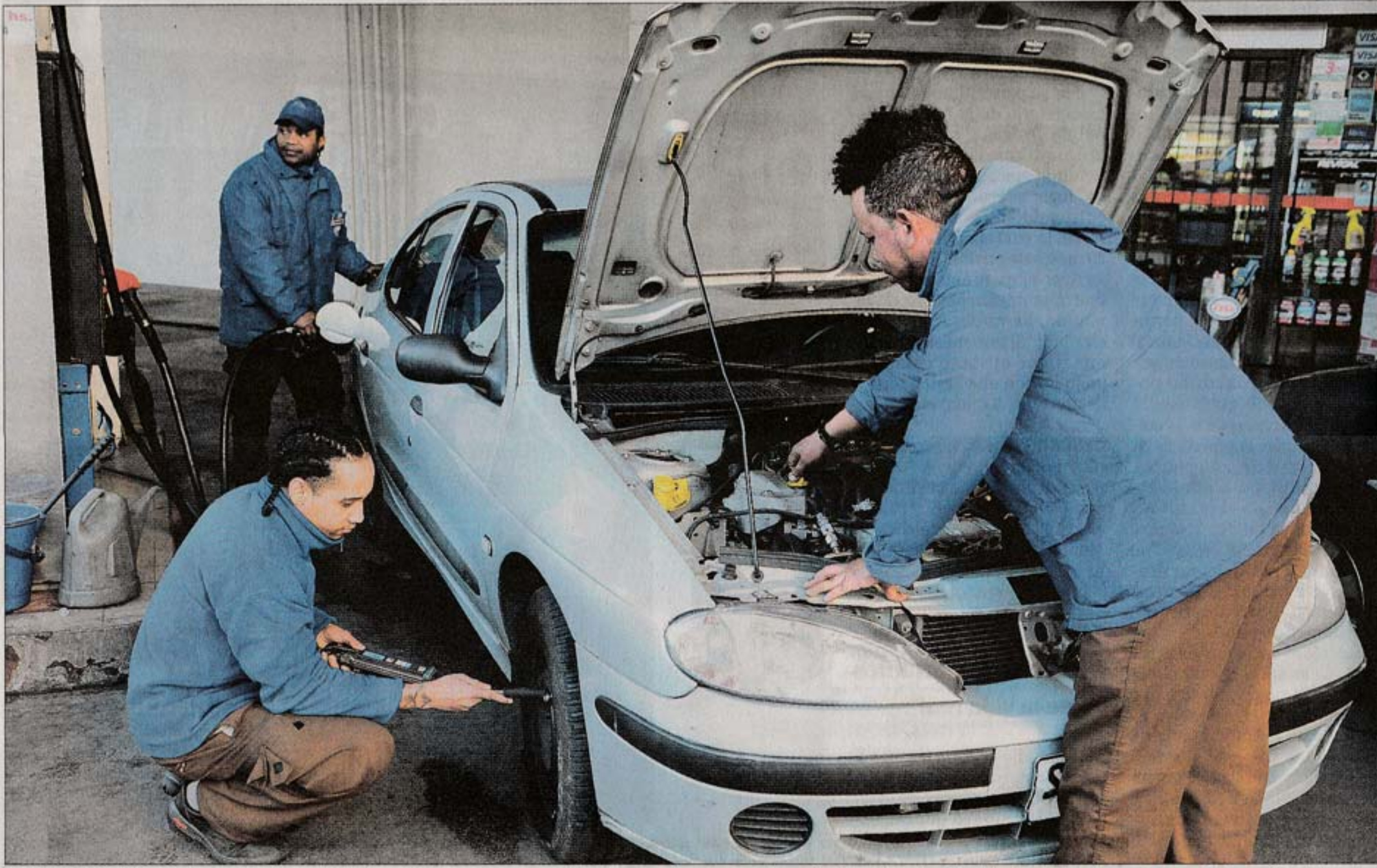
TRABAJADORES. Cada vez más los trabajadores extranjeros ocupan distintos puestos en nuestro país. A muchos de ellos, Uruguay les ofrece una verdadera salida laboral.