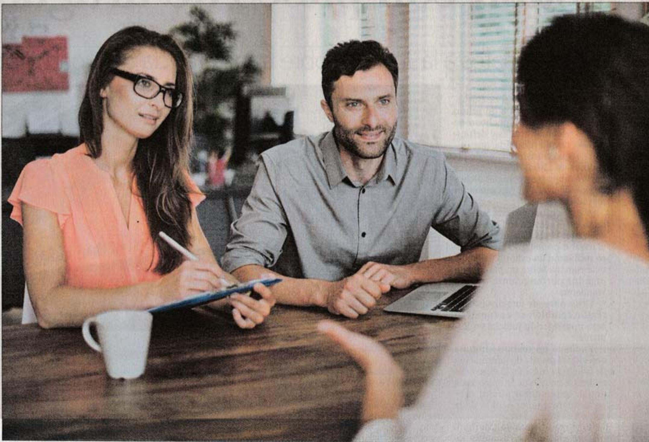
ABRIL EL PAÍS

HABILIDADES. Según un estudio de Manpower, el 65% de los puestos en que trabajarán los nacidos en este milenio aún no han sido inventados.