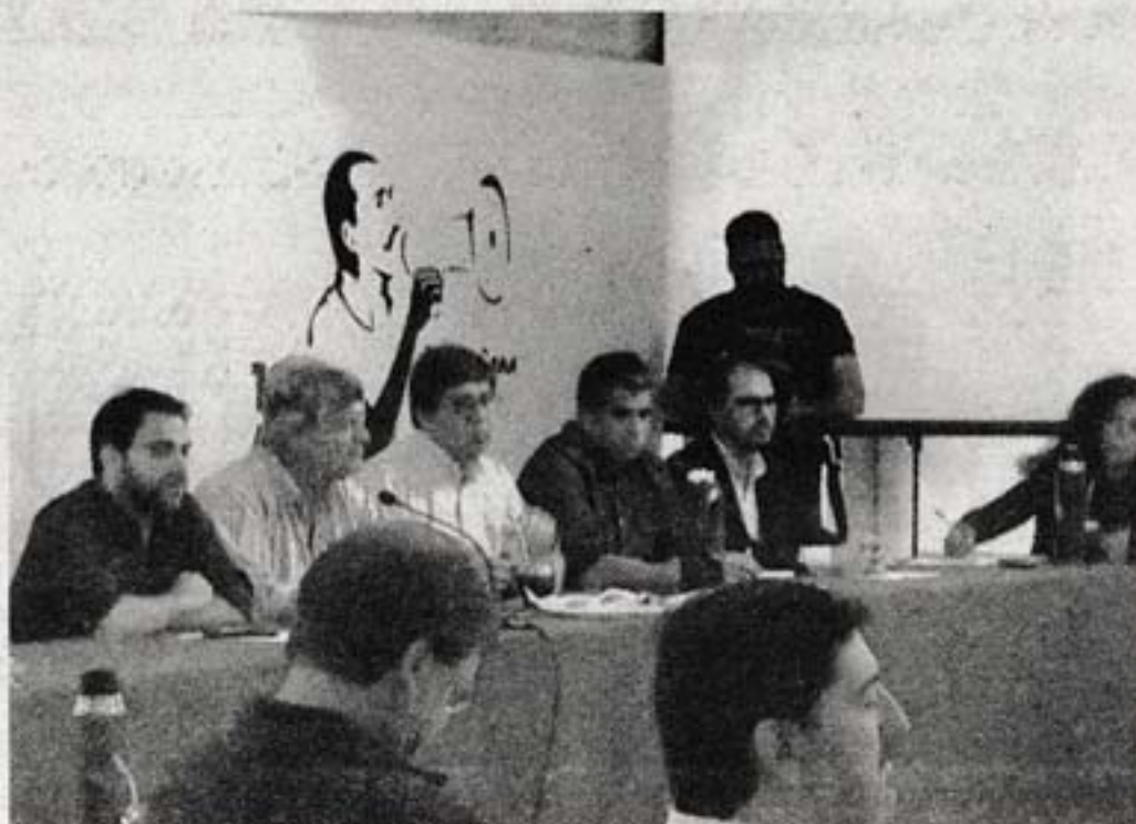
EN LA HUELLA. Las bancadas de diputados y Senadores se reunieron ayer en la sede del FA

Hubo coincidencia en el FA de trabajar que sea aprobada una Rendición de Cuentas que se convierta en una herramienta de crecimiento social, principalmente en el área educativa. Para ello, los legisladores frenteamplistas en el mediano plazo comenzarán un proceso de diálogo con la oposición para asegurar el voto 50 a nivel de la Cámara de Representantes, ya que actualmente, en la orgánica del FA, se cuenta con 49 voluntades que no le daría la mayoría necesaria para aprobar por sí mismo, una iniciativa parlamentaria. Si bien numéricamente la oposición podría llegar a alcanzar los 50 votos en la Cámara Baja, se es conciente que estas fuerzas políticas no son monolíticas y que tienen pueden tener diferentes visiones sobre determinados temas. Por tal motivo, el oficialismo reiteró ayer que proseguirá con el rol propositivo a nivel del Parlamento y que buscará el diálogo y la negociación con la