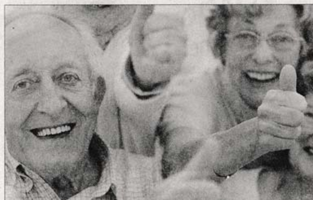
ENTRE 2005 Y 2015. Pasividades han tenido el 50% de incremento real de poder adquisitivo.

"Los aumentos de jubilados y pensionistas son de acuerdo al IMC nominal, que se va acumulando desde enero hasta diciembre. Los Consejos de Salario tuvieron un muy buen comportamiento. La flexibilidad con la pauta que los rigió de la mitad del año hacia adelante incidió notablemente. La negociación colectiva es la que ha traído este IMC que refleja un aumento del