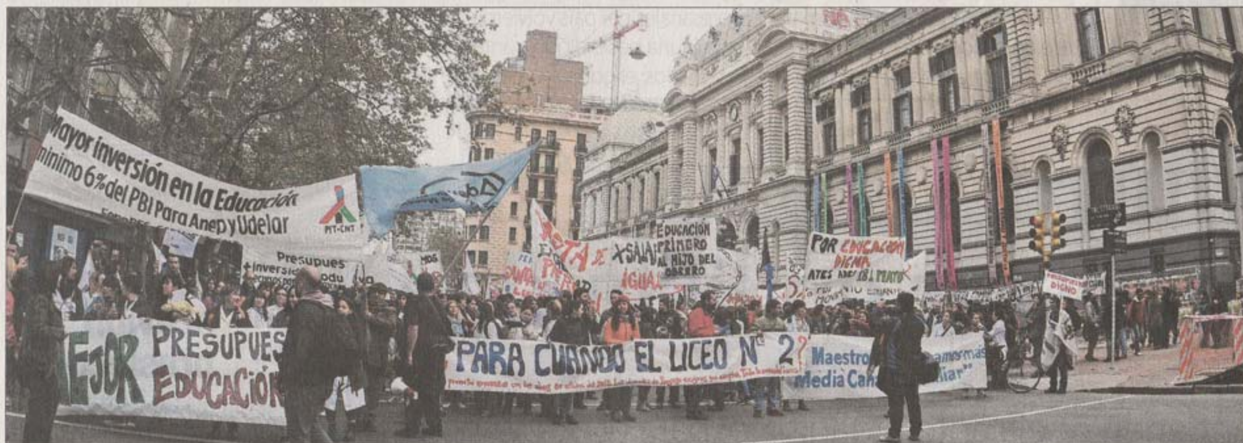
MOVILIZADOS. Los sindicatos de la Educación quieren aumento y el Pit-Cnt los apoya, lo que augura que habrá una dura batalla presupuestal en los próximos meses.