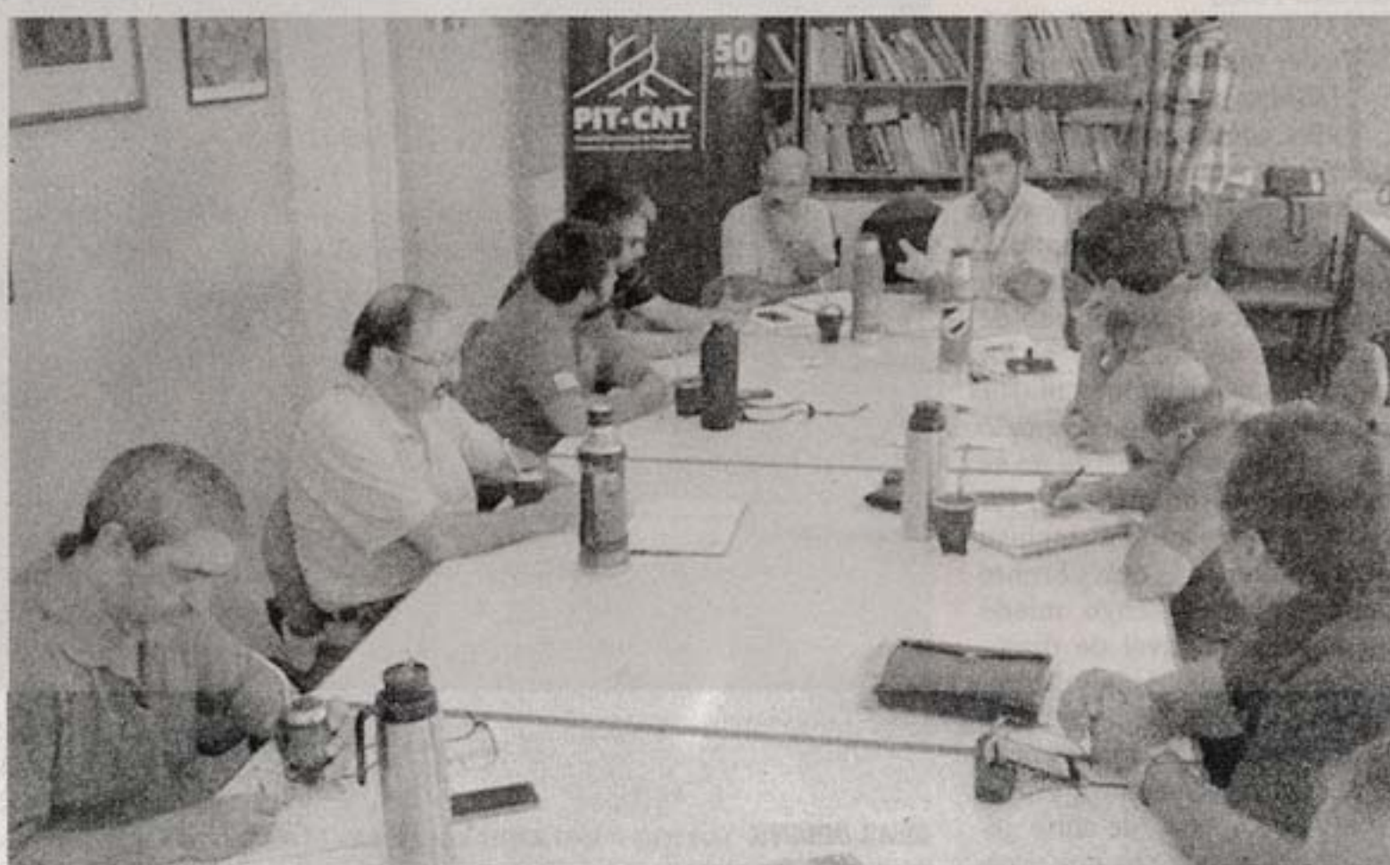
PRIMERA REUNIÓN DEL AÑO. El Secretariado Ejecutivo anunció que defenderá la negociación colectiva a través de la movilización y la lucha.