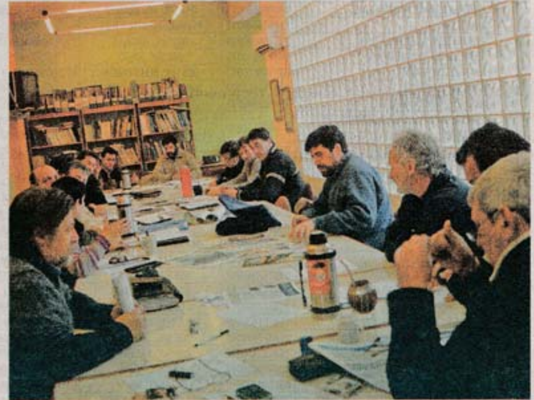
Para el PIT-CNT, el presupuesto presentará un dilema. N. GARRIDO

Por otra parte, Pereira se refirió a la educación y a la necesidad de "negociar con el tiempo suficiente" con los sindicatos. "No es posible negociar un convenio en la educación con 15 días de plazo como se negoció en 2015. No hay tiempo suficiente para intercambiar la información con los traba-