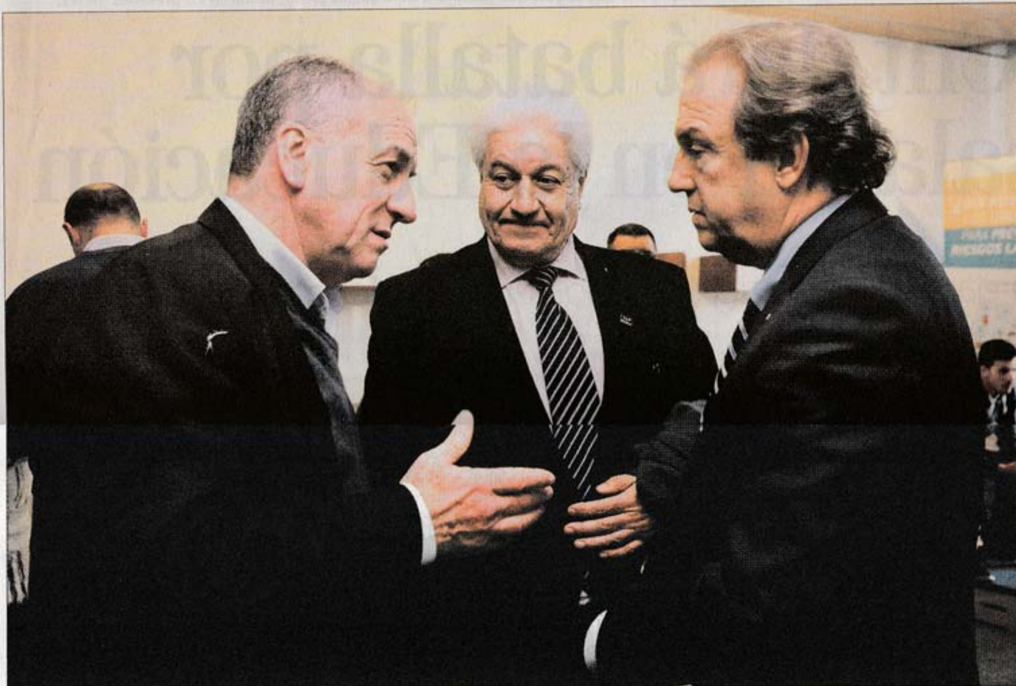
CONVERSACIONES. El gobierno destacó como positiva la reunión con los empresarios y continuarán las negociaciones.

“Los empresarios y trabajadores quieren hacerla tripartita (la negociación). La prueba está en lo que sucedió en el segundo semestre del 2016. Funcionaron 118 Consejos de Salarios y en