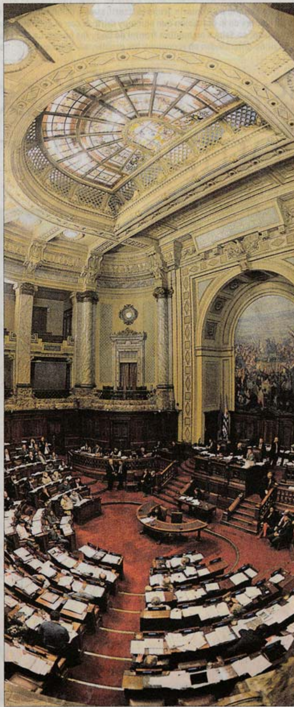
PARLAMENTO. Discutirá Rendición de Cuentas clave para Vázquez