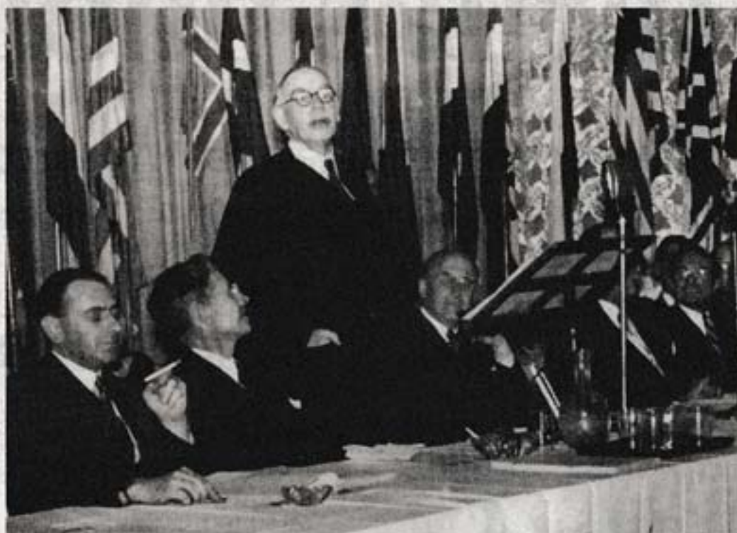
John Maynard Keynes fue uno de los grandes economistas del siglo XX.

Ocho años después del inicio de la crisis, las ideas del economista suscitan aún un enorme debate entre los economistas, desde sus propuestas de utilizar el gasto público para reactivar el