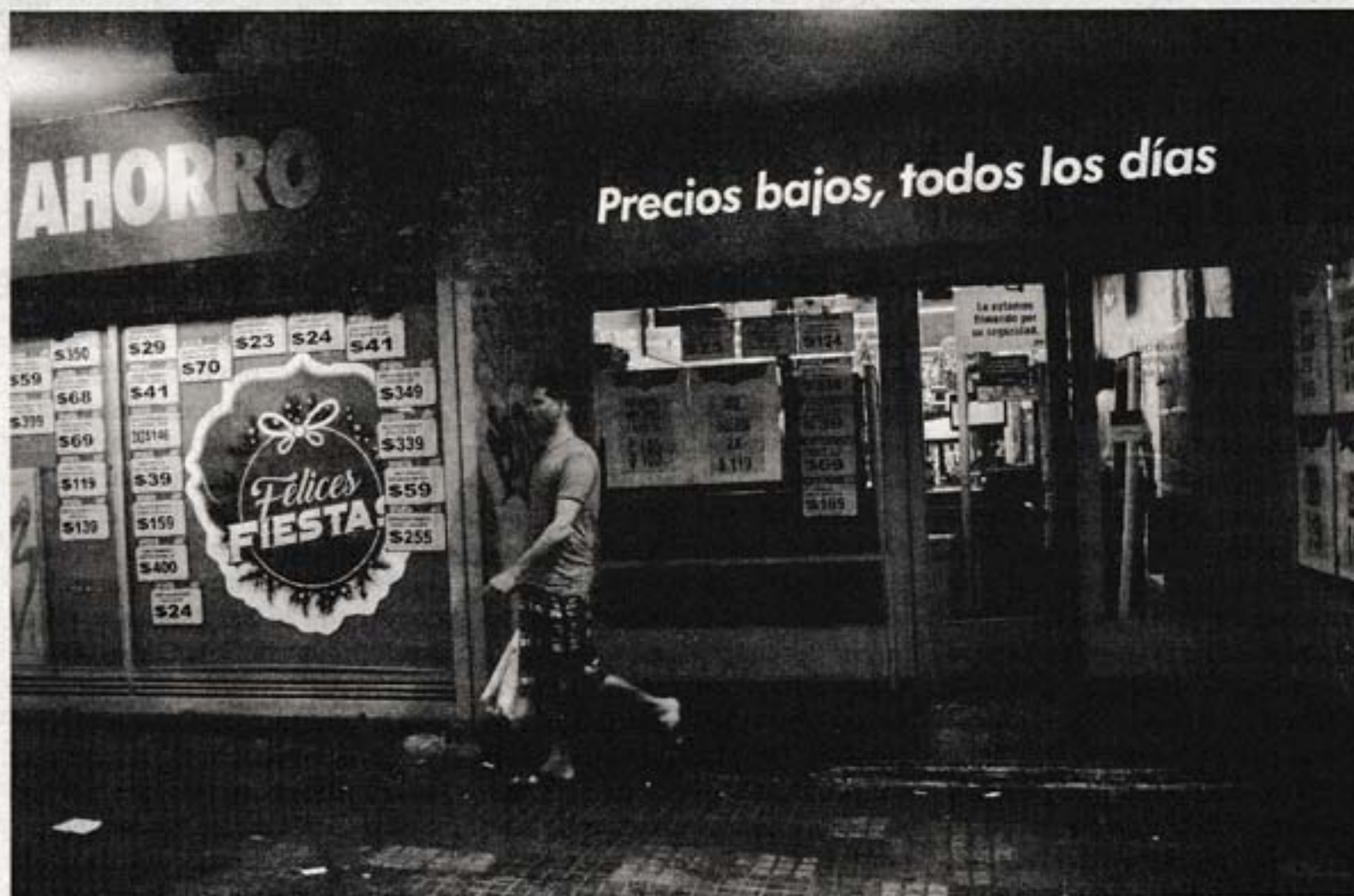
Sucursal del supermercado Multiahorro, en Canelones y Convención.