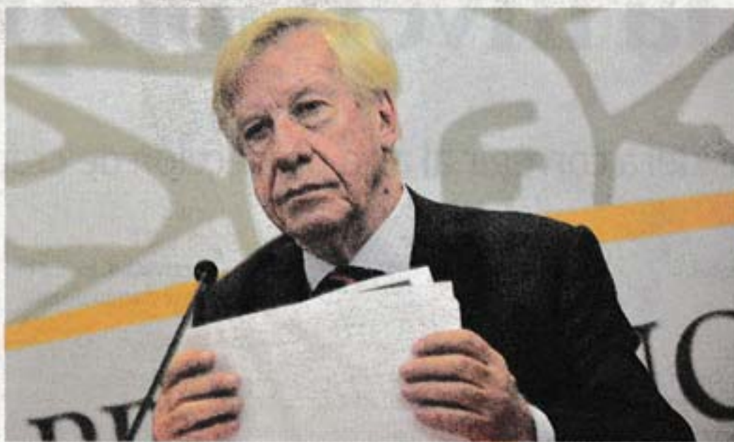
Astori anunció los ajustes que regirán desde enero. C. LEBRATO

El caso más notorio es UTE. A nivel técnico se considera que con