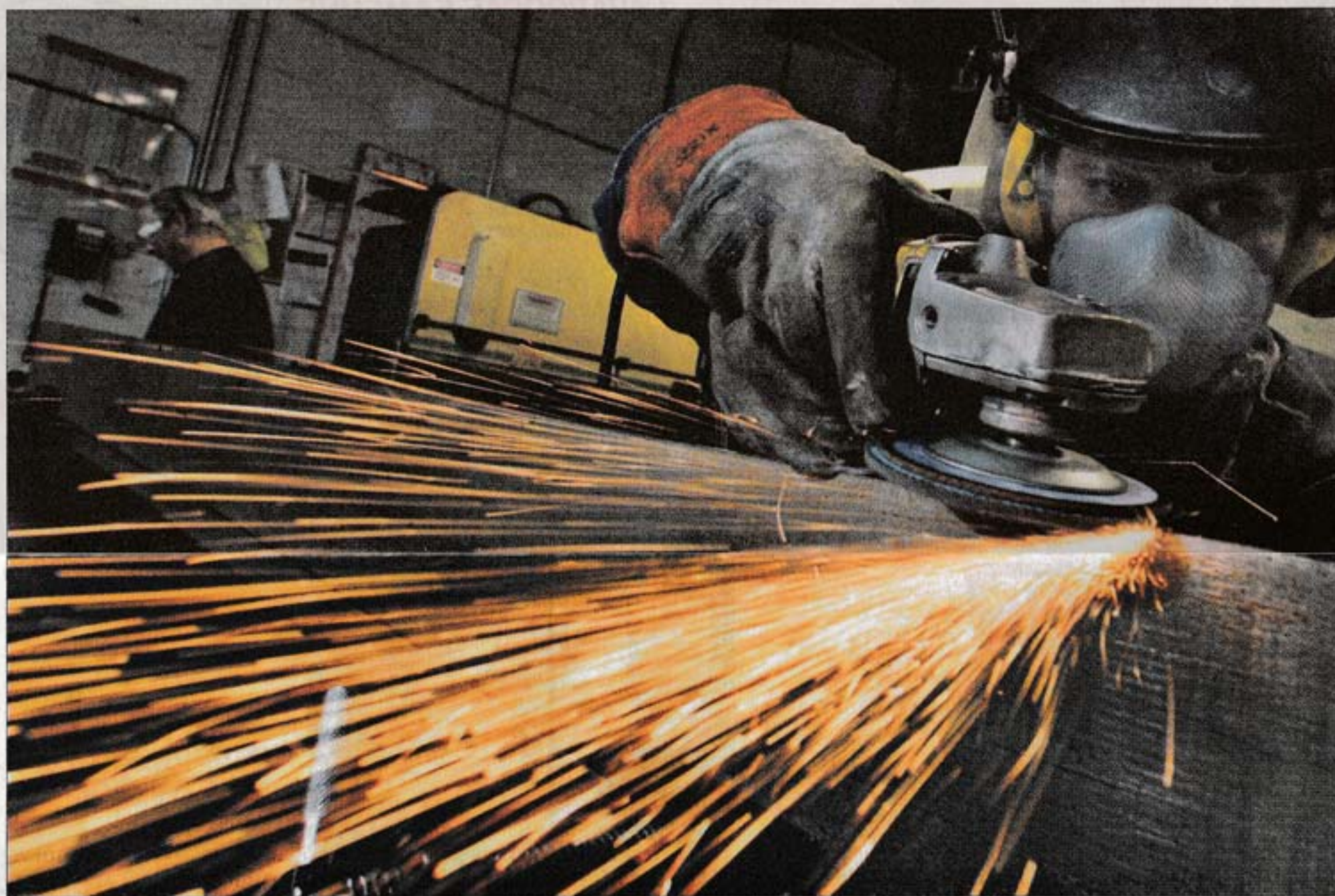
TRABAJO. El 74% de los que trabajan en la industria son obreros, el 22% empleados y el 4% profesionales, según datos de la gremial.

La CIU indicó también que en el tercer trimestre las ventas en volúmenes físicos del núcleo del sector industrial (don-