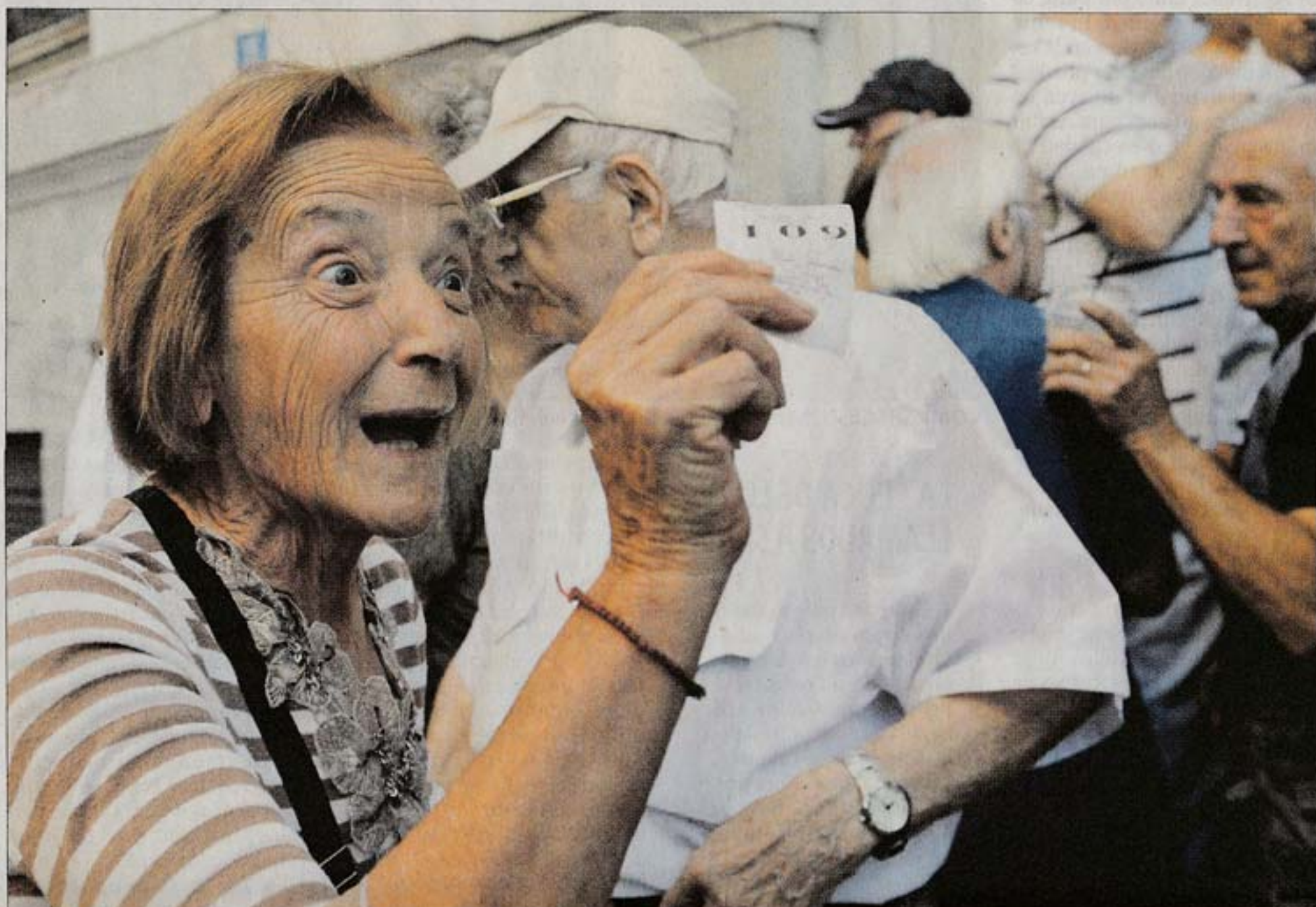
JUBILADOS. En los próximos años habrá más por el pilar de ahorro previsional que cobrarán rentas vitalicias con el nuevo régimen.

Esto provocó que las compañías privadas de seguros autorizadas por el BCU para brindar rentas vitalicias, abandonaran el negocio y que desde 2011 el BSE sea el único actor del mercado. La situación encendió la alarma en las autoridades del