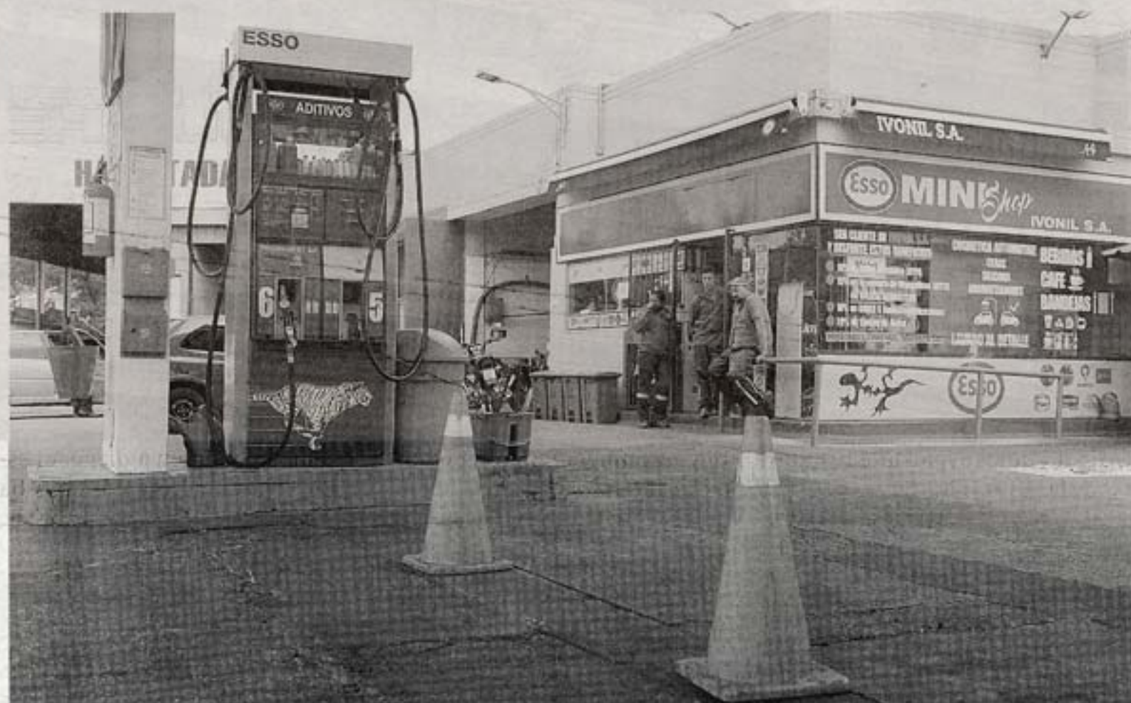
Estaciones de servicio negocian con ANCAP en busca de minimizar efectos de cambios en la distribución.

El cambio planteado implica que la ganancia que percibirán los estacioneros se otorgará en tres franjas en función de los volúmenes de comercialización, y se liberará el precio para las distribuidoras en la boca de salida de la refinería de La Teja, pero se mantendrá tarifada la venta al público. Así, los estacioneros tendrán que comprar al precio que los distribuidores opten por fijarles, y vender al público al precio máximo que decreta el Poder