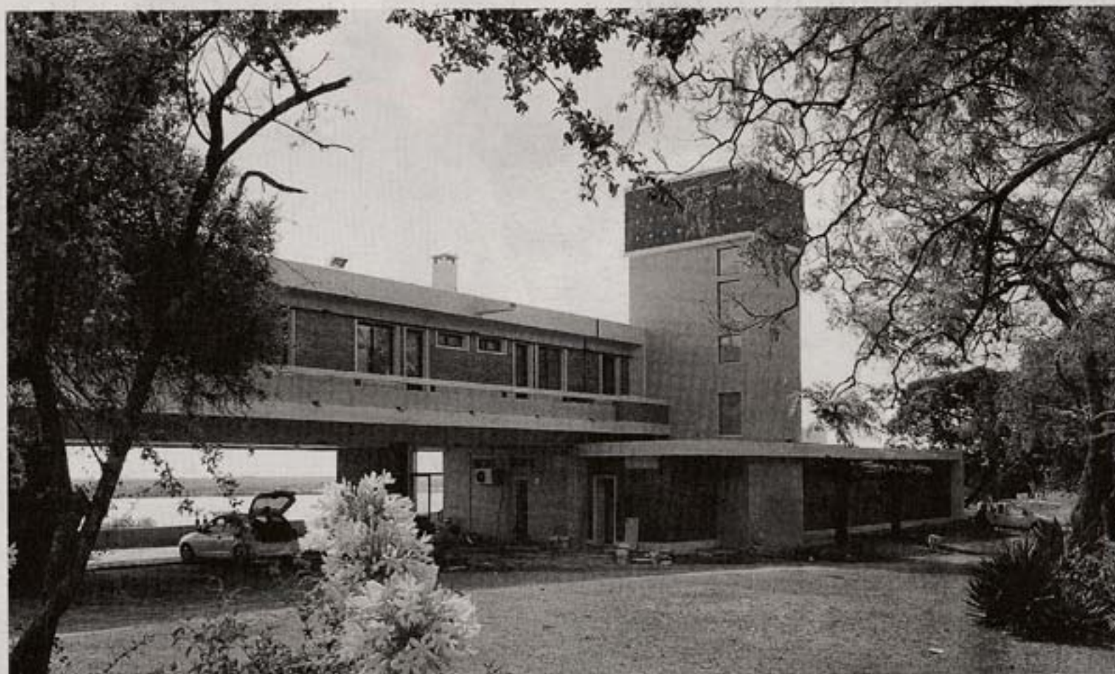
El hotel que gestionará el PIT-CNT se ubica en Punta Gorda.

“Es una obra del movimiento sindical que debería ser hiper valorada porque pasamos de tener un lugar abandonado por varios años a tener un lugar que está espléndido”, dijo a El Observador el presidente del PIT-CNT, Fernando Pereira.