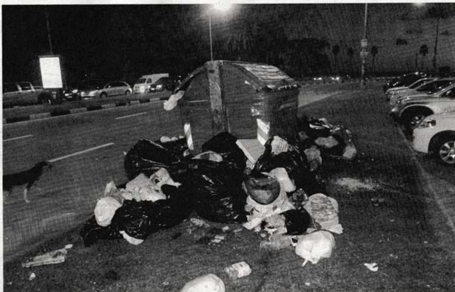
Rambla de Trouville.