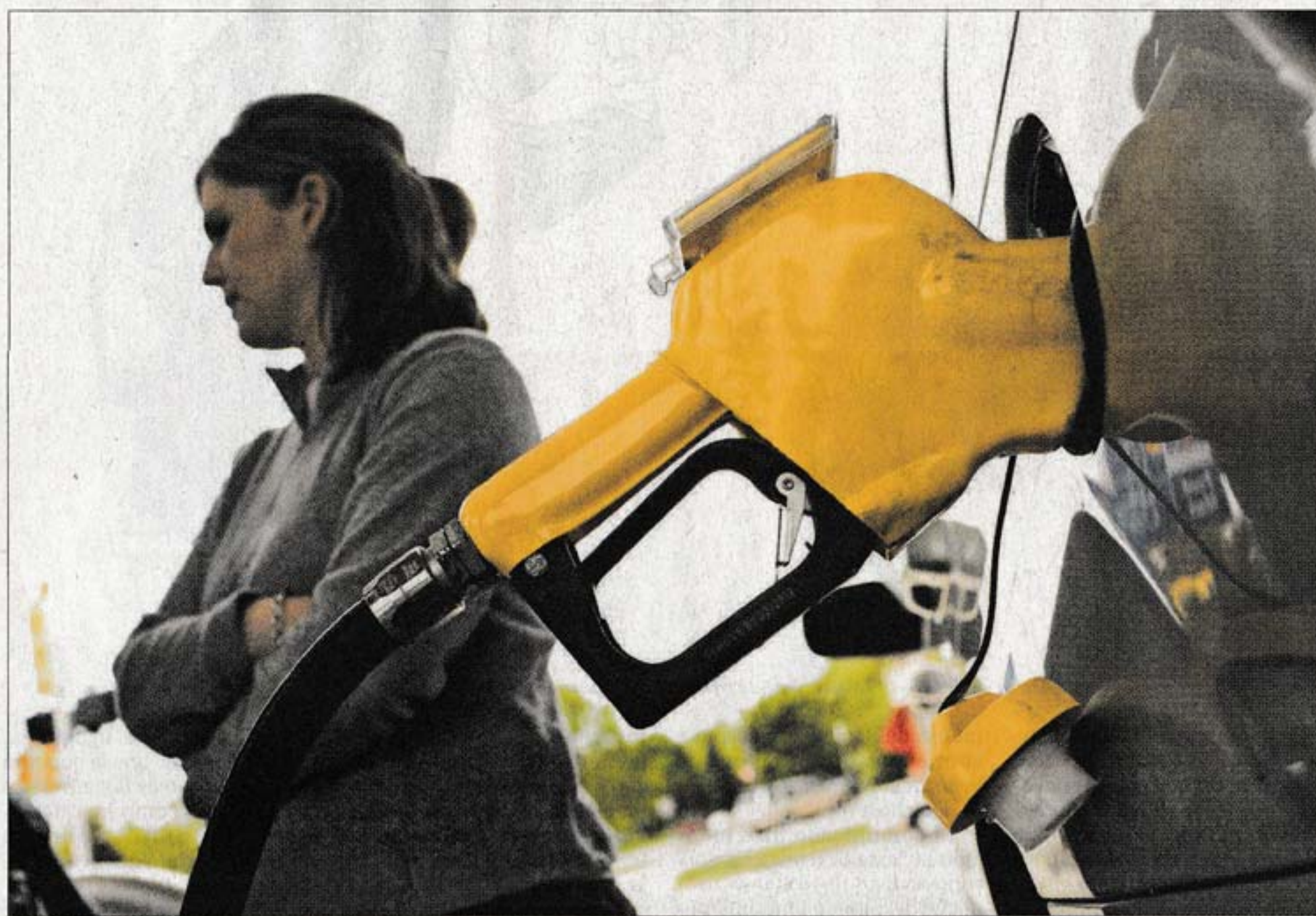
AUTOSERVICIO. Los empresarios dicen que no lo quieren para Uruguay, pero que es una posibilidad si se reduce su rentabilidad.

Según los cálculos de la gremial, que encargó un nuevo análisis de los números del sector a una consultora, el 50% de las bocas de venta se verá perjudicada cuando se reduzcan $ 2,02 los pagos por litro de nafta vendido y $ 1,57 por litro de gasoil. Las "bonificaciones" se reducirían a unas 190 estaciones, aquellas que vendan más de 150.000 litros mensuales. Según Añón, las ventas promedio de las estaciones de servicio de Uruguay son 276.000 litros mensuales y las bocas pe-