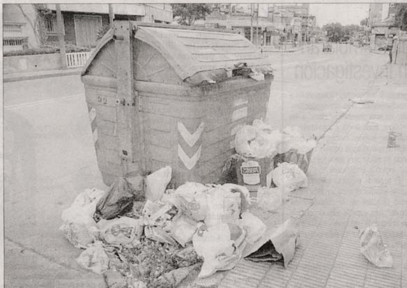
CONTRAATAQUE. Contrató el servicio de 28 camiones a una ONG y dispuso de un sitio de transferencia.

En la última semana, se vino acumulando el volumen de residuos en los contenedores y sus alrededores. Esta situación fue constatada por el Ministerio de Salud Pública (MSP), tras la realización de un monitoreo en la ciudad. La acumulación fuera de los contenedores afecta principalmente los barrios con mayor densidad poblacional, comprendidos en los municipios E y CH.