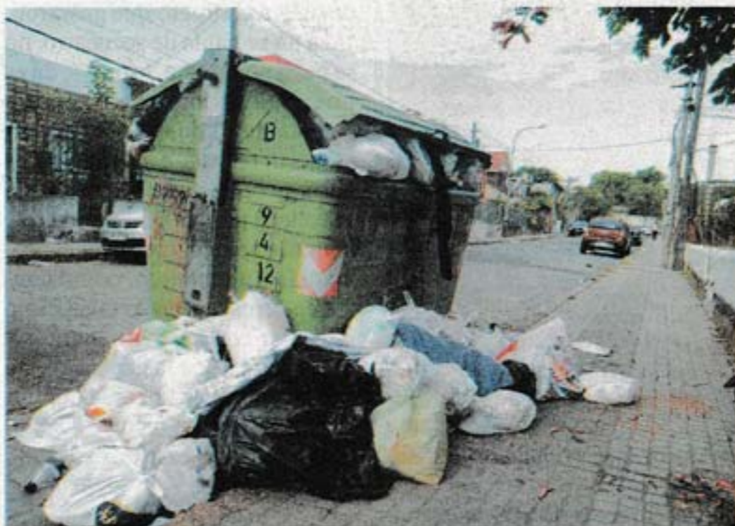
La basura se acumula en calles y contenedores