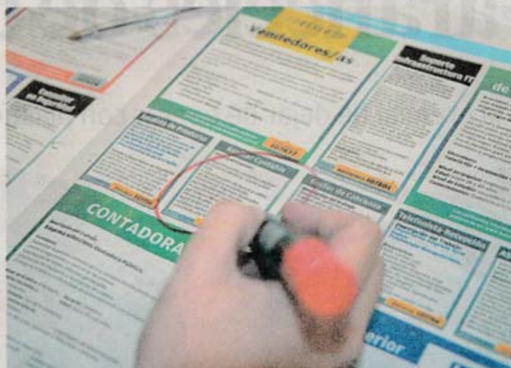
Todas las áreas de actividad mostraron resultados positivos. D. BATTISTE

Al mismo tiempo, la brecha interanual se redujo de forma significativa. Según el informe, la demanda laboral en noviembre fue tan solo 4,35% menor a la del mismo mes del año pasado. Aunque ya se había observado una reducción consistente en la contracción de la demanda al analizar los meses anteriores, la diferencia entre 2015-2016 aún