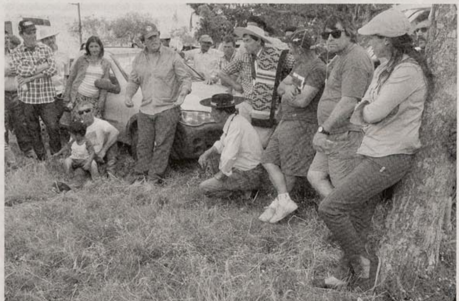
Asamblea de trabajadores rurales, el sábado, en la fracción 2 de la Colonia Emiliano Zapata del Instituto Nacional de Colonización, en el departamento de Tacuarembó.

El Ejecutivo sacará un decreto con el convenio, anunció Rodríguez. La propuesta ubica al sector arrocero como "en problemas" (tal como pedía la patronal) y tendrá los ajustes más bajos, mientras que tambos y ganaderos son considerados de crecimiento intermedio. ■