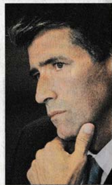
Vicepresidente Raúl Sendic.

lo hice. Me perjudica, pero tengo la tranquilidad de la verdad", declaró, y consideró que ahora se siente "mucho más tranquilo" respecto al tema.