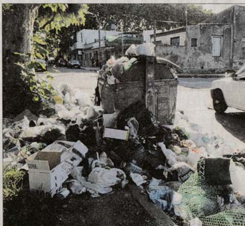
CONTENEDORES. Siguen siendo miles los que quedan sin vaciar.

“Todas las herramientas que tengamos y aún las que no tenemos las vamos a poner en la calle. Y si es necesario solicitar el decreto de esencialidad para que tengamos todas las unidades o todos los funcionarios disponibles durante todo el día para cubrir las tareas, se va a