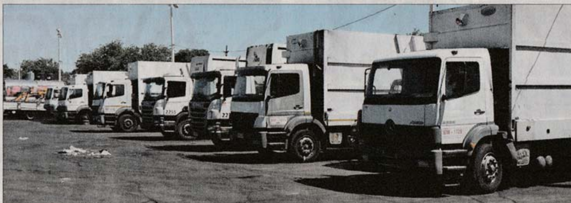
FUERA DE SERVICIO. A los camiones rotos o fuera de servicio (foto), se suman los lavacontenedores, que tampoco salen a la calle.

ESENCIALIDAD. Entrevistado por El País TV, el director de Desarrollo Ambiental de la Intendencia, Óscar Curutchet,