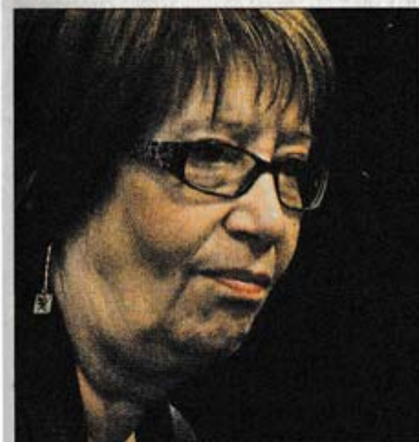
Ministra Marina Arismendi.