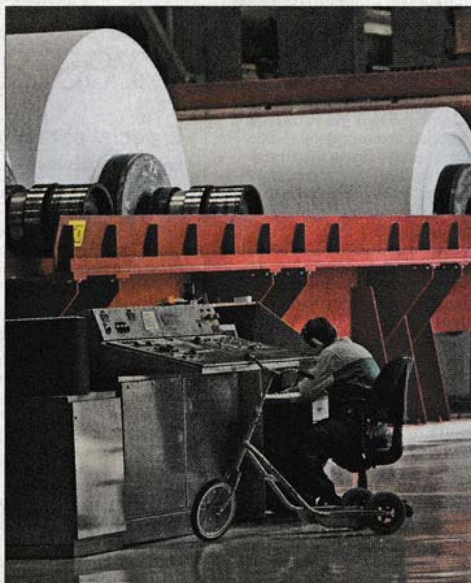
PAPEL. Producción fue la que más incidió en la baja de actividad.

Además, la consultora Deloitte informó que la produc-