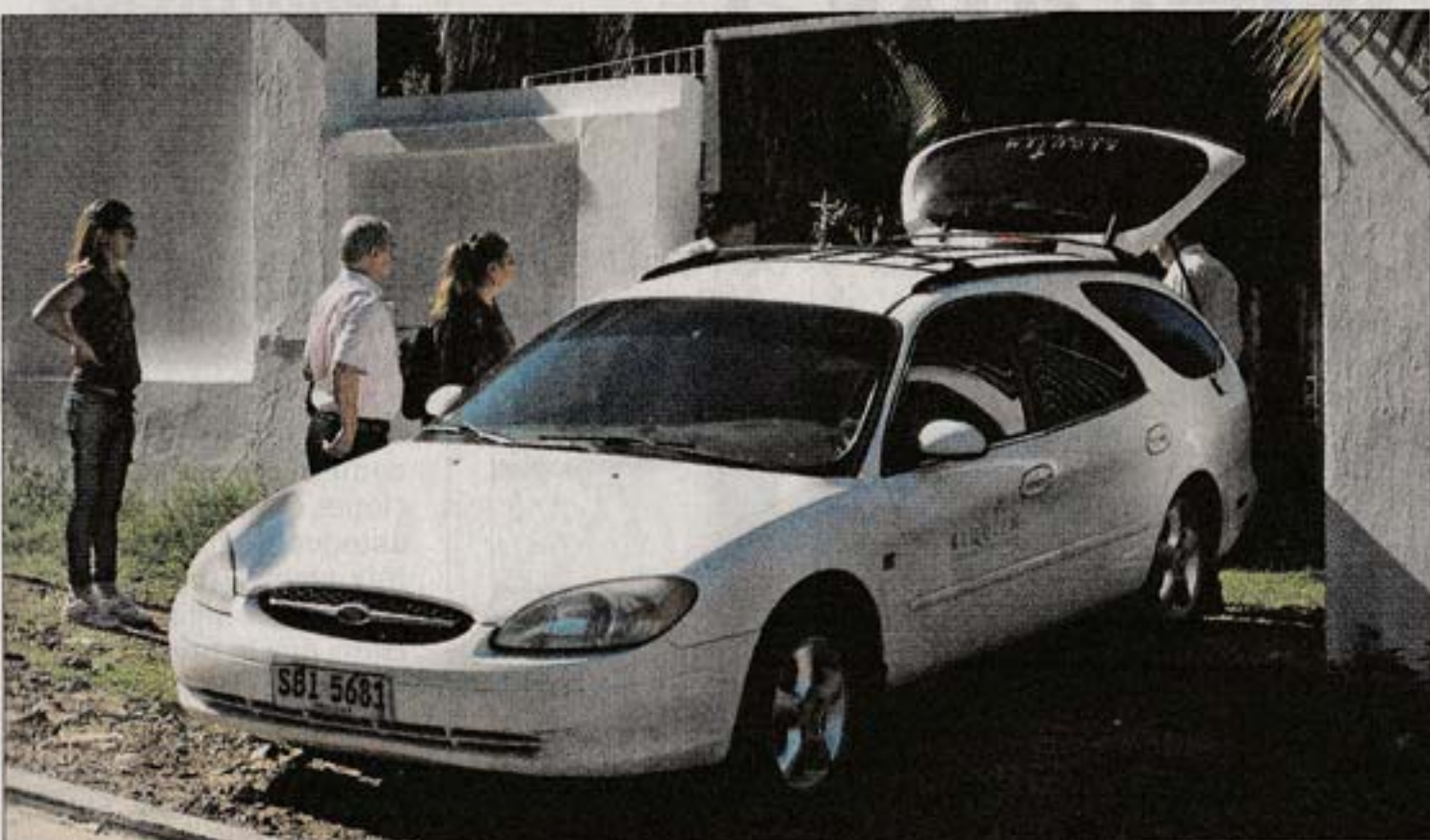
JUDICIAL. La familia del tercer paciente fallecido solicitó una autopsia ante el Juzgado de Salto.