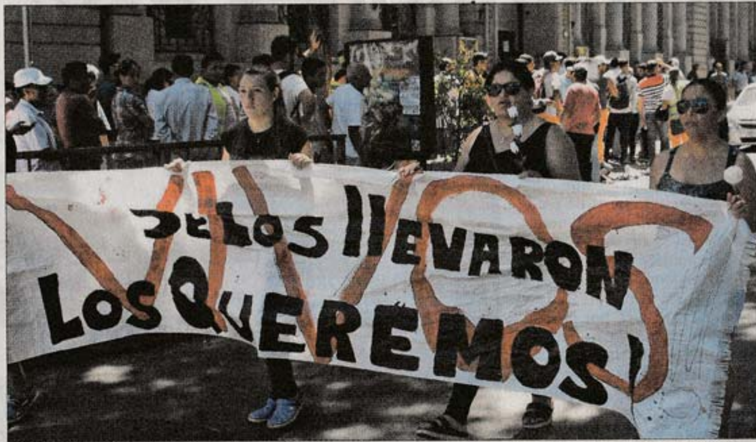
MOVILIZACIÓN. El sindicato de trabajadores del hogar marchó ayer hacia la sede salteña del INAU.