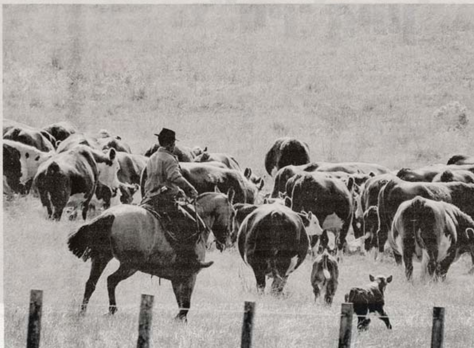
El agro tendrá un convenio bipartito que saldrá por votación entre el Ejecutivo y trabajadores

Además, a partir del 1° de enero deberá otorgarse un ajuste semestral de 5,82% para la primera franja, 5,3% para la segunda y de 4% para los mayores a $ 18.700.