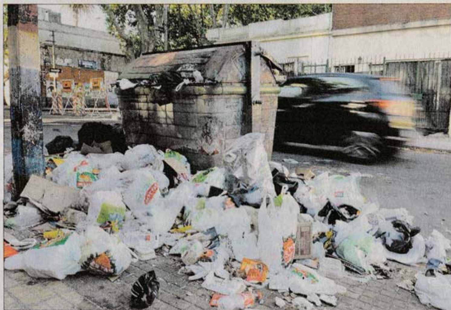
AYER EN LA UNIÓN. Uno de los contenedores que se encuentran saturados, en la calle Cabrera.

VISIONES CONTRAPUESTAS. Adeom declaró insatisfactoria la respuesta de la administración a su plataforma de reivindicaciones para el sector Limpieza. Esta plataforma tiene 11