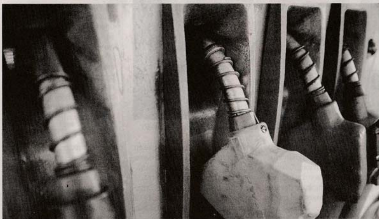
Suministro a distribuidoras privadas será normal aun sin contar con un contrato firmado con el ente.

De todas formas, una fuente indicó que la "voluntad" de ANCAP es "no cortar el suministro" a las distribuidoras privadas.