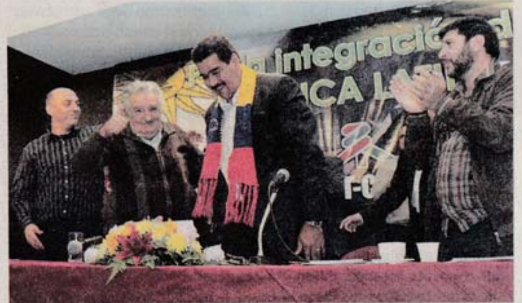
Venezuela tendrá voto en el Mercosur hasta mañana.

Días atrás, el ministro de Relaciones Exteriores, Rodolfo Nin Novoa, dejó clara cuál es la posición de Uruguay. "Estamos discutiendo algunas condiciones. Para Uruguay, lo que va a suceder es que Venezuela va a dejar de ser miembro con voto, porque no ha internalizado toda la normativa del Mercosur. Y ese fue el arreglo